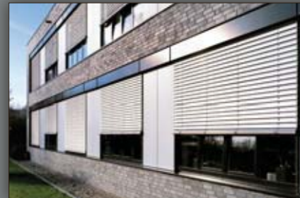
Stort tilbehørsprogram, fx solafskærmning

MOESTRUP Alufacader udvikler og producerer kundetilpassede løsninger fra den tyske industrikoncern Schüco.